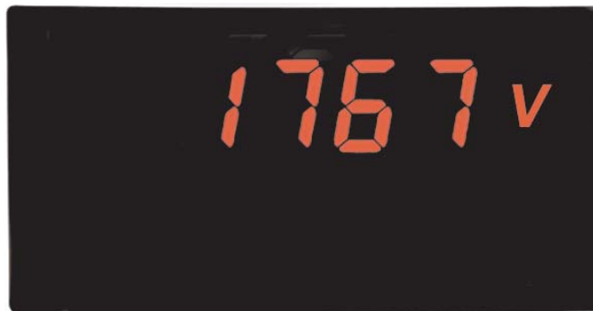
PAXLITE in Originalgröße

PAXLITE-Geräte werden im Maschinen- und Anlagenbau, in der chemischen Industrie, der Kunststoffindustrie, der Nahrungsmittelindustrie, der Verpackungs- und Fördertechnik und in vielen anderen Bereichen eingesetzt und helfen dort bei der Automatisierung und Vereinfachung von Arbeitsprozessen. Hohe Ströme bis 5 AAC können skaliert und in der gewünschten physikalischen Einheit angezeigt werden.