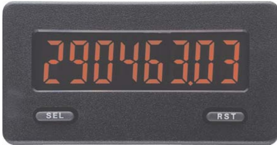
CUB 5 in Originalgröße

Der CUB5 ist eine preiswerte Anzeige für 2 Zählwerte und eine Geschwindigkeit. Er kann z.B. als Positions-, Drehzahl-, Stückzahl-, Geschwindigkeits- oder Durchfluss-Anzeige verwendet werden und lässt sich durch seine einfache Programmierung sofort in Betrieb nehmen.