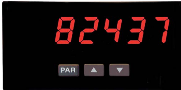
PAX LC in Originalgröße

Der Industrie - Zähler PAX LC kann natürlich auch als sehr flexibles und genaues Laborgerät eingesetzt werden. Er wurde aber mit dem robusten Kunststoffgehäuse und der hohen Schutzart IP 65 für den rauen Industrieinsatz konzipiert. Die weltweit eingesetzte, ausgereifte und auf Langlebigkeit ausgelegte Elektronik erhält vor Auslieferung einen 3 Tage langen Qualitätstest unter Vollast. Das Gerät wird direkt über 3 Tasten schnell und sicher projektiert.