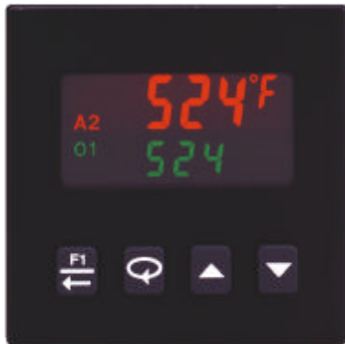
T16 in Originalgröße

Dieser kleine Temperatur-/Prozessregler ist ein Alleskönner. Mit einem neu entwickelten Thermo-ASIC ausgerüstet, werden moderne Programmier- Bedien- und Kontrolltechnologien in einem für den rauen industriellen Einsatz konzipierten Gehäuse realisiert. Alles wurde dafür getan, damit der T16 schnell in Betrieb genommen, einfach und sicher bedient werden kann und seine Aufgabe jahrelang effizient ausführt. Schließlich sorgt eine überlegene Funktionalität für die einfache Anpassung an alle erdenklichen Regelaufgaben.