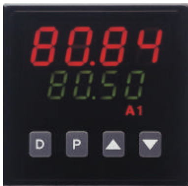
T48 in Originalgröße

Dieser kleine Temperaturregler ist ein Alleskönner. Mit einem neu entwickelten Thermo-ASIC ausgerüstet, werden moderne Programmier- Bedien- und Kontrolltechnologien in einem für den rauen industriellen Einsatz konzipierten Gehäuse realisiert. Alles wurde dafür getan, damit der T48 schnell in Betrieb genommen, einfach und sicher bedient werden kann und seine Aufgabe jahrelang effizient ausführt. Schließlich sorgt eine überlegene Funktionalität für die einfache Anpassung an alle erdenklichen Regelaufgaben.